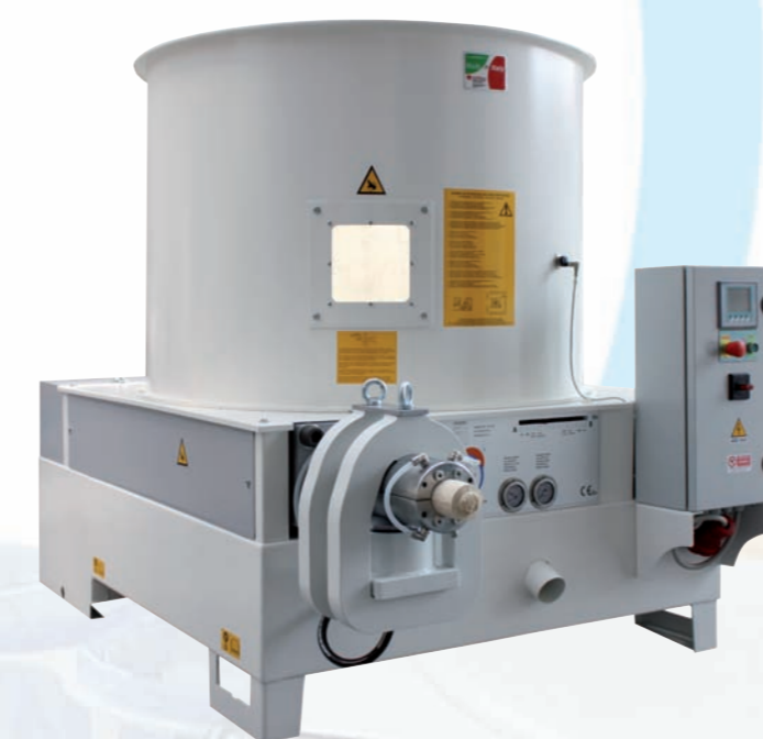
Modelli E70 - E80

La produzione è subordinata al tipo di materiale.