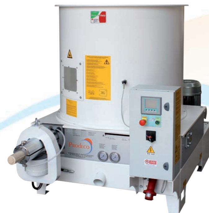
Modelli E60 - E60 Super - E70 Eco