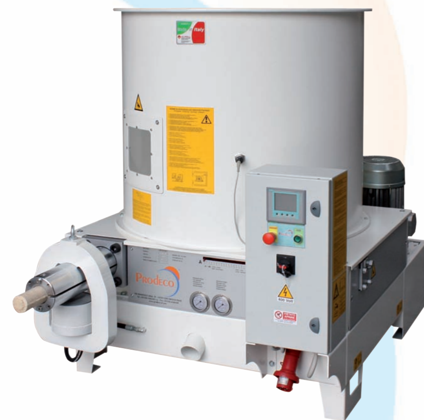
Modelli E55 - E60 ECO

La produzione è subordinata al tipo di materiale.